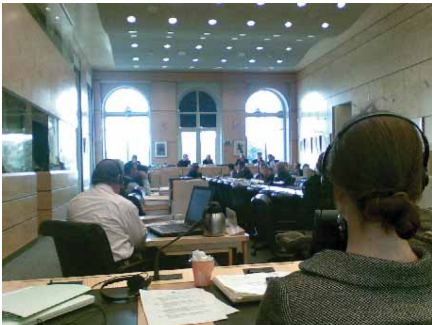
Детаљ са заседања Комитета УН за економска, социјална и културна права, Женева, новембар 2008. године