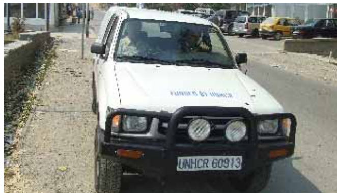
Србица, центар Дренице

Стижем у договорено време. Десетак паркираних аутобуса за Пећ, Баковицу, Дечане, Приштину, Косовску Митровицу и друге градове, већ пуни. За Призрен крећу два аутобуса. Добијам место непосредно поред