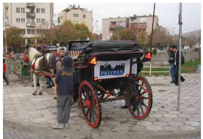
Да ли ће нас само фотјографије њодсећаићи на Призрен?

Негодују што држава Србија није нашла модус да реши егзистенционална питања расељених како не би морали да продају своју имовину. На крају крајева, то је њихово право. Својом имовином могу да располажу како им воља. Ипак, остаје горак укус у грлу након ове посете, и питање како убедити оне ситуираније да то