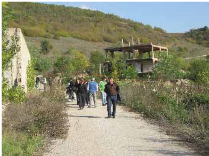
Долац: у обиласку села...