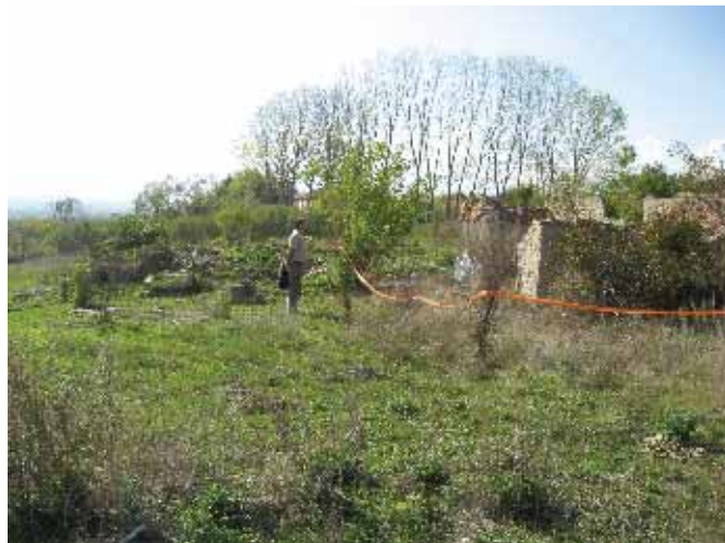
... забрањен прилаз (октобар 2008. године).