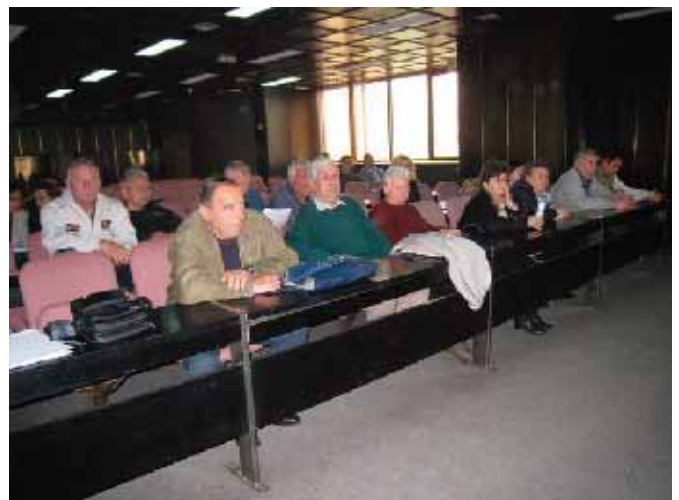
Састанак у зради Скупштинине општинске Призрен

Успут, Призренце питамо зашто, с обзиром да су тако близу административног прелаза, нису до сада ишли до своје куће. Поново исти одговор, страх, безбедност, слобода кретања. Брзо стижемо до Брезовице где проводимо прву ноћ. Све време пута и одмора на Брезовици наши сапутници причају о избегличким мукама у колективном центру. Покушавамо да дођемо до одговора коме је боље (ако некоме уопште може да буде боље), онима у колективном центру који не плаћају комуналије и закуп простора (овде имају чак и топлу воду из водовода), и који могу да очекују решење стамбеног питања од државе, или њиховим сапутницима који од 1999. године плаћају закупнину и све комуналије (струју, воду и друго) и немају никакве наде