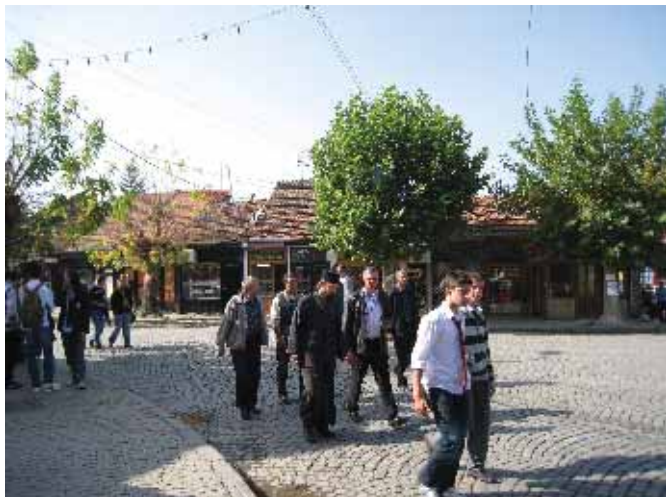
Призренци у шетњи Шадрваном...