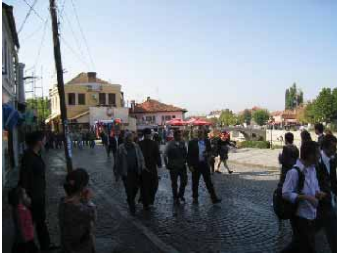
Шетња Шадрваном у њраињи монаха из В. Дечана

Ђорђа у којој су од овог месеца почели да живе свештеници. Нестварна слика, поготово за оне који су први пут од 1999. у свом граду и до сада су понекад