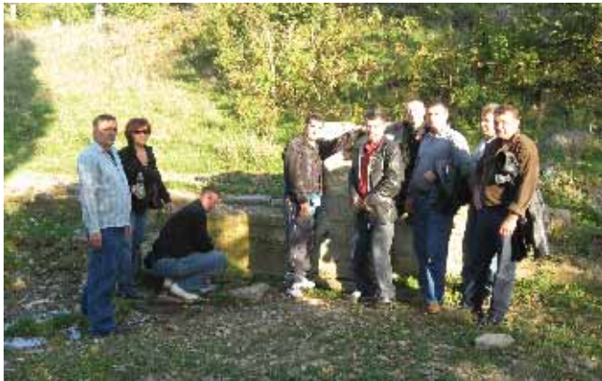
Испред порушене сеоске чесме

Већина од њих после девет година, први пут одлазе на Косово и Метохију. Знају из прича оних који су били