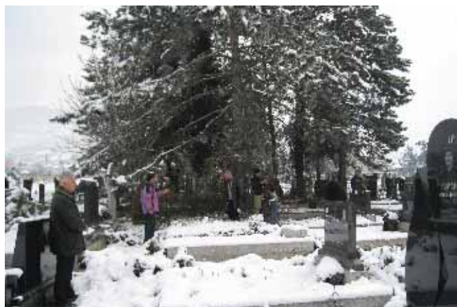
... и призренског православног гробља (новембар 2008. год).