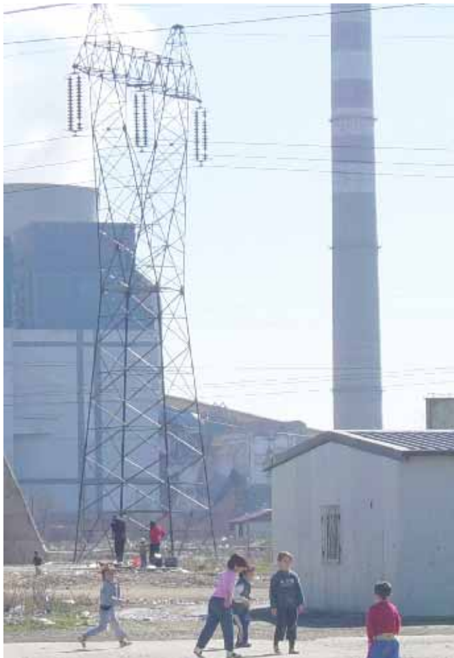
Животи под далеководима

У сличној ситуацији се налазе и они који су се вратили на КиМ. Нарочито је тешко ромским