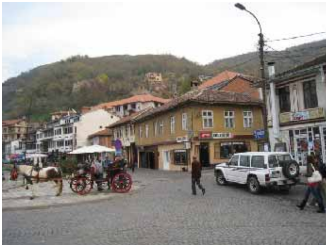
Призрен, циљ путовања

Састављачу ових редова годи констатација представника UNHCR-а, који у слободном разговору пре почетка информативног састанка каже да се у свим