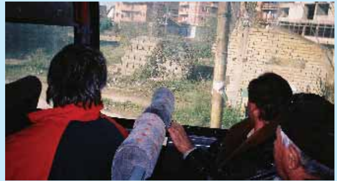
Дворане: за сада само поглед из аутобуса