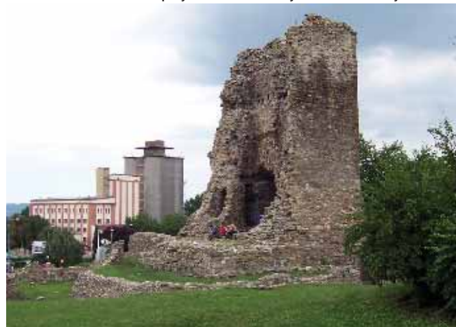
Крушевац – Сћари град, ново љребивалишће