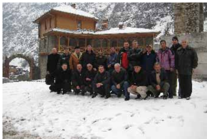
Због снега, Врбичани стигли само до... ... манастира Свешти Арханђели...