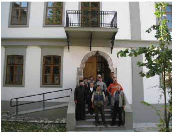
За усјомену, слика њред обновљеном зградом Богословије

Ипак, све те наизглед нестварне слике, нису промениле њихову намеру коју су дуго крили у себи. Продаја