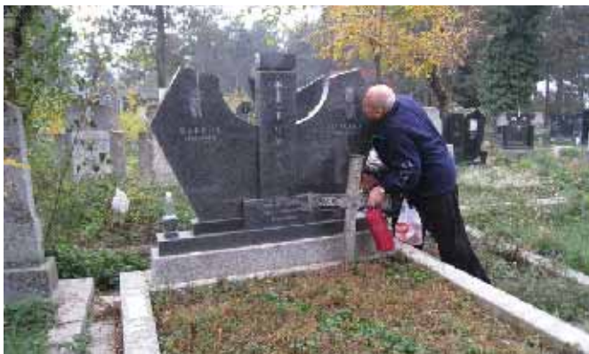
Испред уређеног гроба

На гробљу, у тишини, свако се удаљује према свом одредишту. Понегде се чује плач. Почињу са уређењем гробља. Шетам околу. Кажу, у односу на 2005. годину, када нису могле да приђу гробовима, данас је ситуација много боља. Гробна места су доступна. Треба их само још мало уредити. Заслуге за то има и удружење "Свети Спас" чији представници редовно присуствују састанцима у општини, у настојању да се што пре створе услови за повратак оних који за то изразе жељу. Појединци констатују да је у међувремену дошло до мањих оштећења неких споменика. Трагови зуба времена, или намере злонамерника?