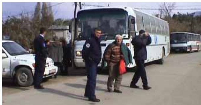
Аутобусима до Призрена

Упутили су ме на удружење “Свети Спас”, организацију која се, како су ме упознали, од 1999. године бави разним врстама помоћи расељенима са Косова и Метохије. У просторијама Удружења, као у кошници, пуно расељених. Две године нису били у могућности да оду на Задушнице. Не верују да ће им се то омогућити ни овога пута, али за сваки случај уписују се. Срдачно су ме дочекали. Након објашњења разлога мог доласка, добио сам нешто штампаног материјала из којег сам