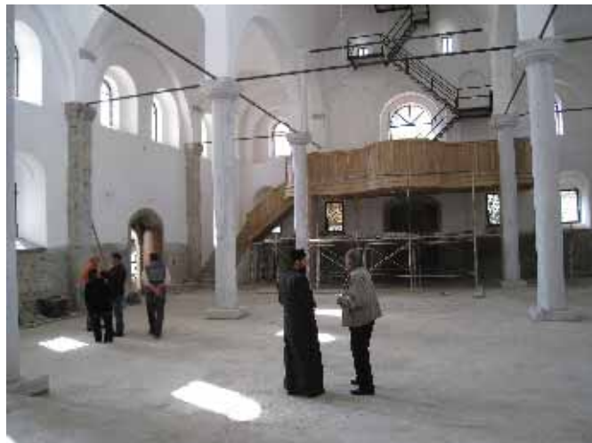
...и у посети цркви Св. Ђорђа (октобар 2008. године).