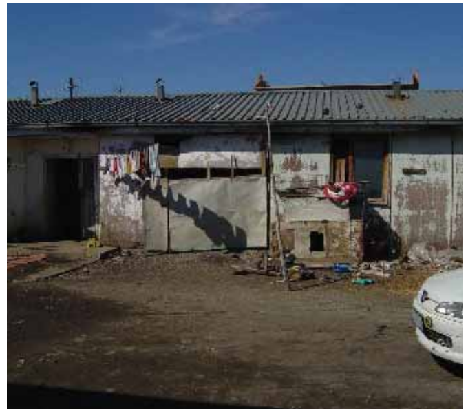
Племетина – колективни центар